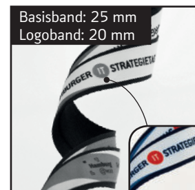
Maximale Motivbreite: 17 mm