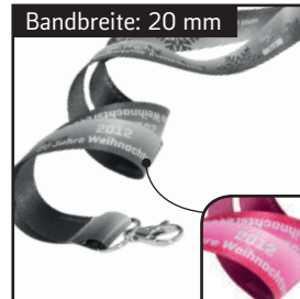
Maximale Motivbreite: 17 mm