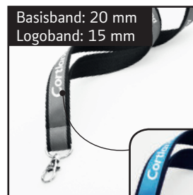
Maximale Motivbreite: 12 mm