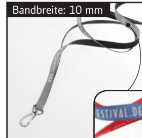
Maximale Motivbreite: 7 mm