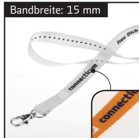
Maximale Motivbreite: 12 mm